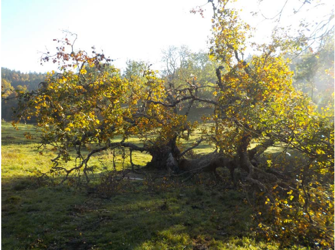
Notre pauvre vieil arbre le 28 septembre 2017.