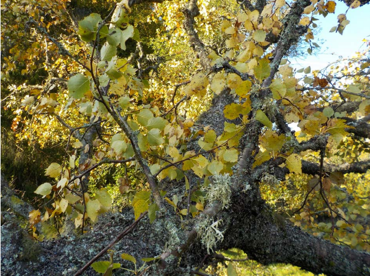
Un bouleau verruqueux presque sans doute.